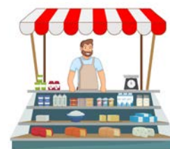
Vendita (mercato locale)