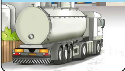
Conferimento allo stabilimento (autocisterna refrigerata)