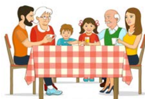
Consumo in famiglia