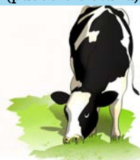
Allevamento degli animali (pascolo e stalla)