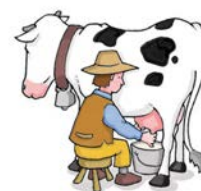
Mungitura manuale del latte (secchio e bidone)